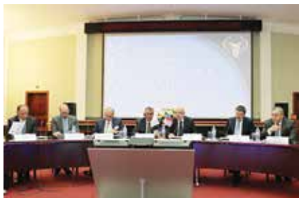
Президиум бизнес-форума «Кипр — Россия: новые возможности для делового и инвестиционного сотрудничества»

исторические, политические, экономические, культурные и религиозные связи.