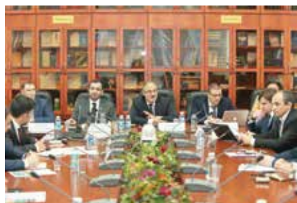
Президиум конференции «Дубай: возможности экспорта и организации бизнеса в ОАЭ и странах Персидского залива»