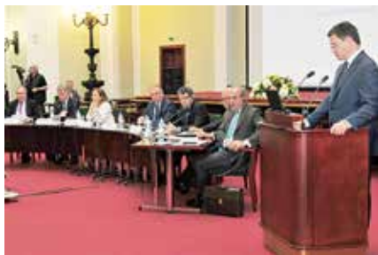
Российско-испанский бизнес-форум в ТПП РФ

Президент Торговой палаты Испании Хосе Луис Бонет и председатель Российско-испанского делового совета, председатель Правления ПАО «Новатэк» Леонид Михельсон рассказали о возможных новых направлениях взаимодействия российского и испанского бизнеса. Испания поставляет в Россию, в частности, оборудование для химической промышленности. Испанские инвесторы готовы вложить средства в проект «Арктик-СПГ», который в ближайшее время планирует запустить ПАО «Новатэк», сообщил Л. Михельсон.