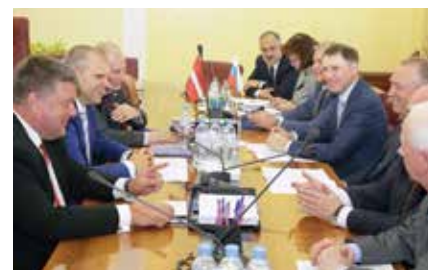
Круглый стол по вопросам российско-латвийского сотрудничества

Вопросы приграничного и межрегионального сотрудничества должны также лечь в основу дальнейшей деятельности Российско-Латвийского делового совета. ТПП России планирует обсудить данное направление с новым руководством Делового совета в ходе организационного заседания в июле 2017 г.