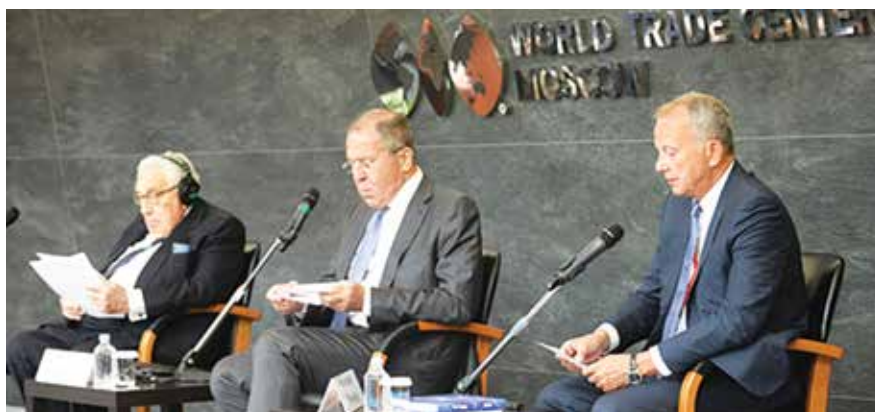
Второй день «Примаковских чтений» открыла специальная сессия, в ходе которой выступили министр иностранных дел РФ Сергей Лавров и бывший государственный секретарь США Генри Киссинджер

В рамках форума состоялись: круглый стол «Общественная правовая экспертиза и общественный мониторинг правоприменения в сфере интеллектуальной собственности», круглый стол «Разработка патентной стратегии организации: методические подходы и практические шаги», тематическая секция «Повышение конкурентоспособности предприятий за счет планирования и эффективного управления результатами научно-технической деятельности (РНТД)», тематическая секция «Расширение сети Центров поддержки технологий и инноваций (ЦПТИ), создаваемых на площадках торгово-промышленных палат», тематическая секция «Актуальные вопросы эффективности коммерциализации интеллектуальной собственности на творческий продукт», круглый стол «Правовая охрана и защита прав на товарные знаки», международная конференция «Актуальные вопросы международного оборота объектов интеллектуальной собственности в современных условиях».