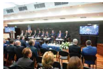
Участники Российско-чешского бизнес-форума