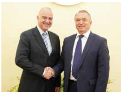
Посол Хорватии в России Тончи Станинич и Президент ТПП РФ Сергей Каттырин

Министр энергетики РФ, глава российской части Межправительственной смешанной российско-испанской комиссии по экономическому и промышленному сотрудничеству Александр Новак сообщил, что, несмотря на непростые времена, в первом квартале взаимный товарооборот вырос почти в полтора раза (российский импорт — на одну треть, а экспорт — на две трети), хотя в прежние годы достигались и более высокие результаты.